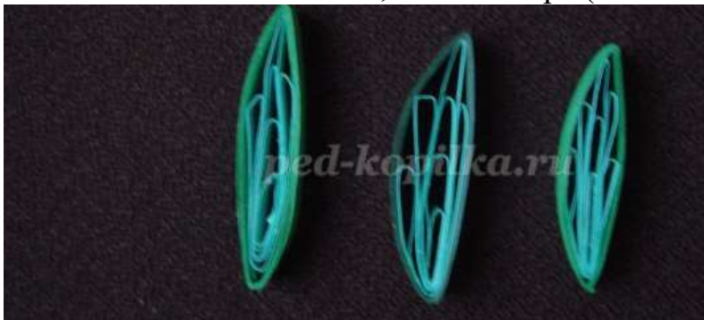
23. Большой лист 11 сантиметров (14 булавок) и завиток.