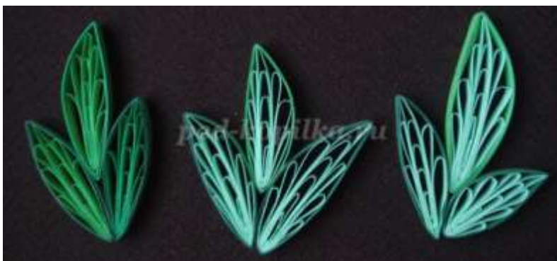
22. Маленькие листья по 2,5 сантиметра (в сколке использовались 8 булавок)